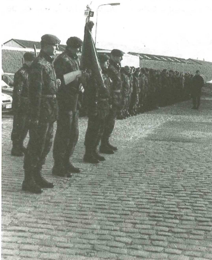
Vaandelwacht van het Garderegiment Fuses- liers, opgesteld naast C-Compagnie