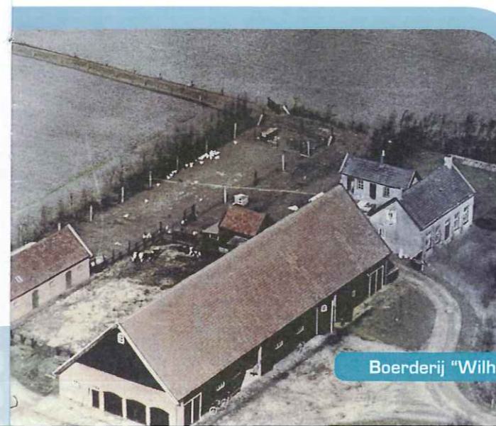
Boerderij "Wilhelmina" aan de huidige Vlietenburgweg

Iemand die deel uitmaakt van ongeregelde troepen. Ook guerrillastrijder genoemd. Een Guerrillastrijder strijd tegen indringers of tegen de eigen overheid.