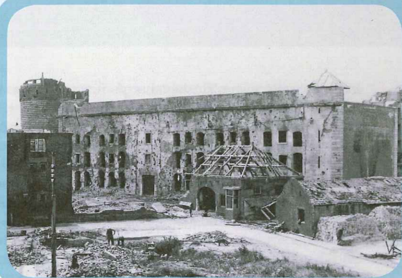
Kazerne Vlissingen oktober 1944