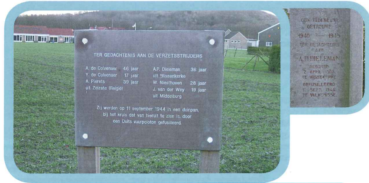
Plaquette op de kruising Klaassesweg- Valkenisseweg en detail monument Dieleman.

De Duitsers vonden hem een saboteur, maar was hij dat ook? Wat vind jij?