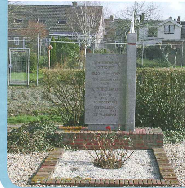
Monument Dieleman, Wissenkerke

Op 6 september blijkt alles een vergissing en komen ze weer terug.