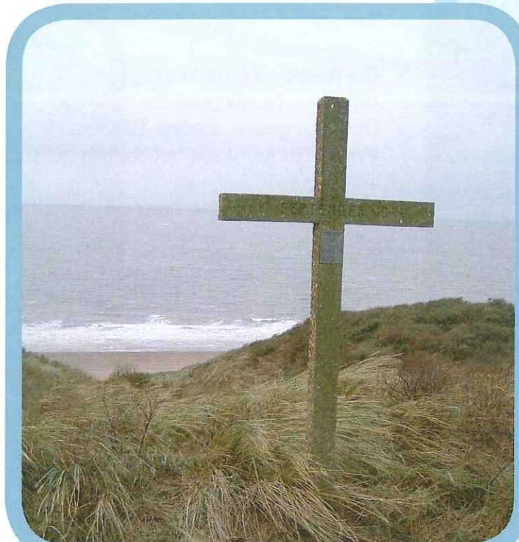
Kruis in de duinen bij Klein-Valkenisse

Dit verhaal hebben wij geschreven zodat jullie weten wat er is gebeurd op Noord-Beveland. Het is belangrijk de geschiedenis van dit tragische voorval op ons eiland door te vertellen.