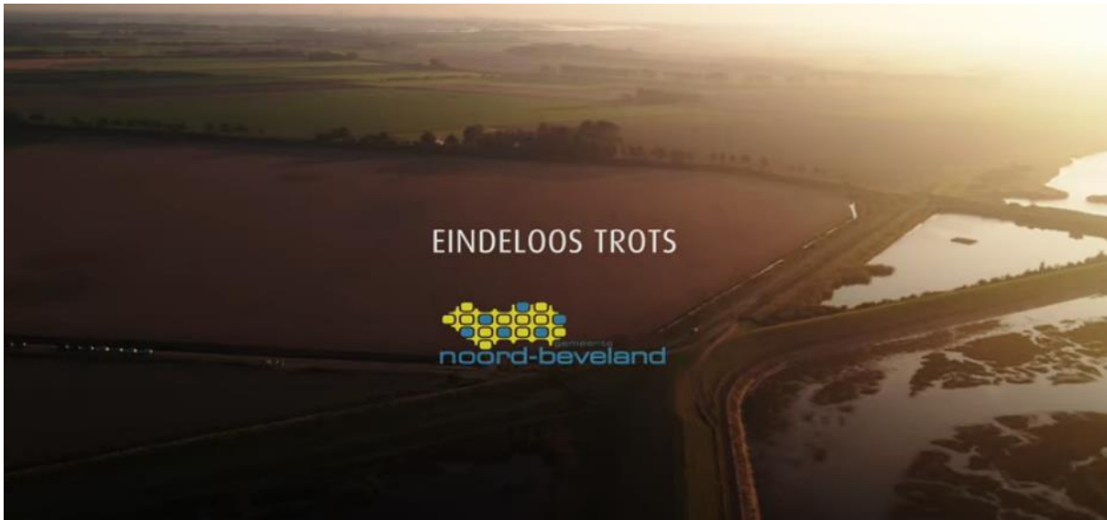
Screenshot video 'Eindeloos Trots'

Cultuur is iets eigens. Iets persoonlijks, maar ook iets collectiefs. Iets om trots op te zijn!