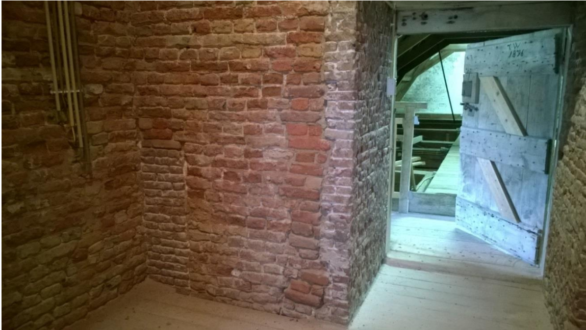
In moppen uitgevoerd metselwerk van de toren met linksonder een dichtzetting in kleinere steen in Lange Vecht formaat. De doorgang naar de kerkkap is afgewerkt in hergebruikte steen van een ander formaat.

Op zijn vroegst is bij de bouw van deze 17 e eeuwse kerk de scheiboog tussen toren en schip dichtgezet met hergebruikte steen met niet al te strak aangehouden verband en met steen van verschillend formaat, vermetseld in een schrale kalkmortel. Zowel op de baksteen van het oorspronkelijke werk, als op de baksteen van de dichtzetting bevinden zich kalkresten. Deze resten hebben echter een verschillende oorsprong.