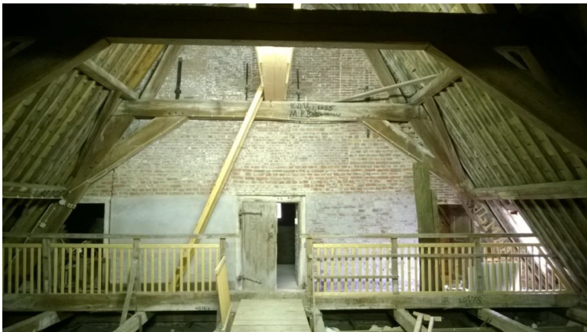
Oostelijke torengewel met verschillende baksteenformaten en typen schootankers. Midden de doorgang naar de toren. Links en rechts de doorgangen naar de kappen van de ter weerszijde van de toren gelegen ruimten.

Tegen de toren is in 1686 een nieuwe kerk gebouwd, mogelijk op de fundering en met gebruikmaking van opgaand werk van de voorganger, waarbij het koor niet werd hersteld of herbouwd. Mogelijk bevindt zich hierdoor nog middeleeuws metselwerk in het huidige werk wat mogelijk, mede ten gevolge van de Ramp van 1953, de hoge zoutconcentratie verklaart in de onderste delen van de kerkgevels.