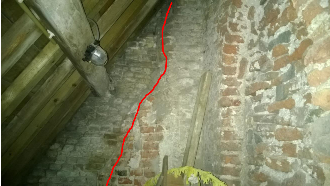
Kap van de zuidelijk naast de toren gelegen ruimte met rechts de gevel van de toren in kloostermoppen met blindnis. Midden de aanzet van de oorspronkelijke westgevel van de kerk met links het lichter uitgevoerde 17 e eeuwse metselwerk.