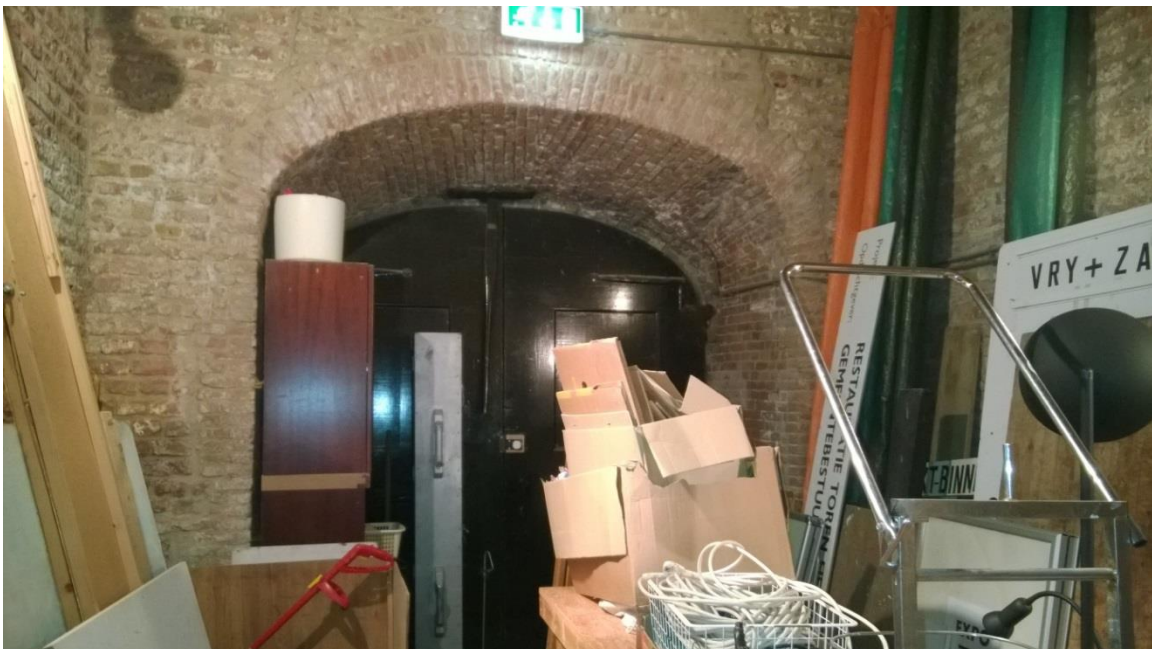
Entree van de toren, aangepast in kleinere steen. Elders de oorspronkelijke 15 e eeuwse moppen.

De bouwsporen onderschrijven grotendeels de geschiedenis zoals die uit de literatuur bekend is. De toren, in oorsprong opgebouwd uit kloostermoppen, kwam na de overstromingen in de 16 e eeuw grotendeels vrij te staan. Bij de herstelling van de toren zal de buitenhuid vervangen zijn, of van een klamp voorzien in een kleiner formaat steen. Dit is herkenbaar in het interieur van de toren, waar rond de gevelopeningen, aanpassingen in de vormgeving zijn gedaan met de ook in de gevels voorkomende kleinere steen.