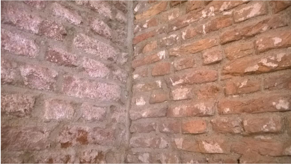
Detail aansluiting dichtzetting rechts en torenwand links.