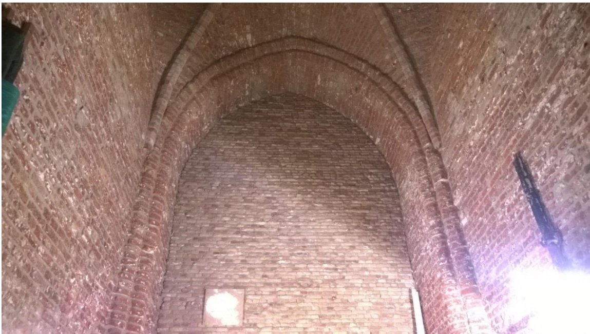
Dichtgezette scheiboog tussen kerk en toren

Bij de 17 e eeuwse herbouw is gekozen de entree van de kerk te verplaatsen naar de oostgevel, waarvoor een oudere zandstenen poort is hergebruikt. De poort is opgenomen in het metselwerk. Er zijn geen sporen aangetroffen van een plaatsing nadat het gevel metselwerk tot stand is gekomen. Mogelijk was de poort onderdeel van de oorspronkelijke kerk en vertoont zeer sterke gelijkenis met de poort in de westgevel van de toren.