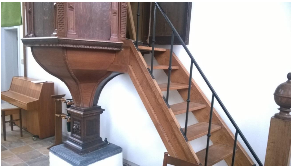
Trap en onderste deel van de preekstoel