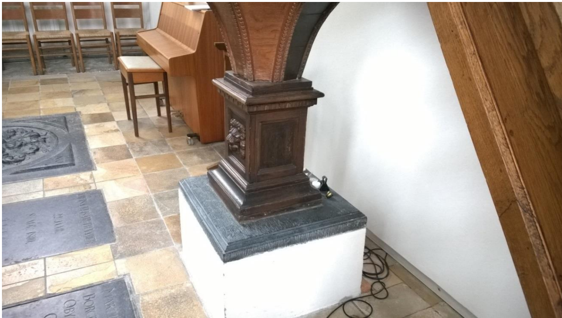
Verhoogd basement van de preekstoel