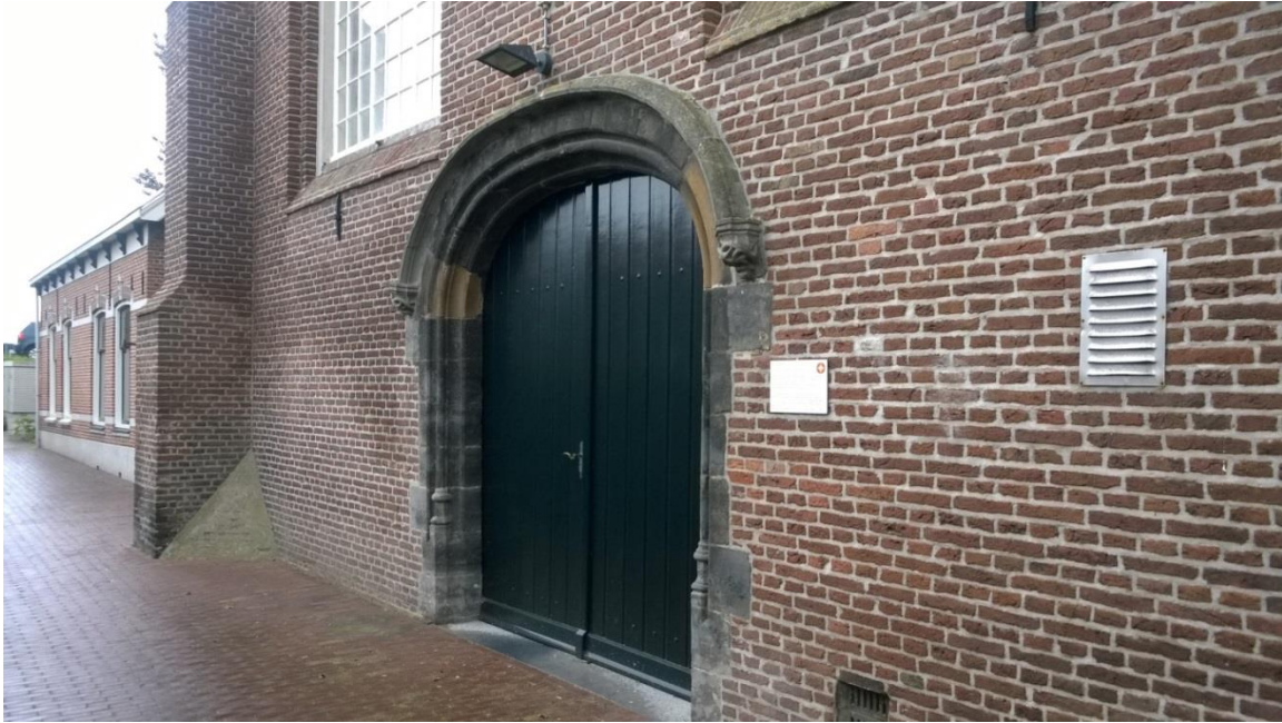
Entree van de kerk.

Het dichtzetten van de scheiboog kan echter ook behoren tot een latere verbouwing, waarschijnlijk om mogelijk te maken dat de preekstoel aan de oostgevel kan worden geplaatst. Hiervoor pleit de aanwezigheid van een memoristeen uit 1754 naast de entree van de toren. Deze is aangebracht ter herinnering aan bouwwerkzaamheden. Als toen de entree van de kerk al aan de oostzijde was gelegen, ligt het voor de hand dat de steen naast de (hoofd) entree zou zijn aangebracht. Dit pleit er voor dat de entree in de 18 e eeuw (ook) nog via de toren mogelijk was.