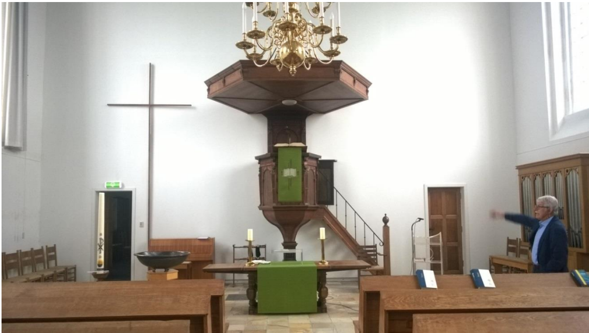
Westgevel van de kerkzaal met preekstoel en klankbord. Links en rechts de toegangen naar de naast de toren gelegen ruimten.

De trap en het klankbord van de preekstoel wijzen op een plaatsing eind 19 e begin van de 20 ste eeuw, hoewel de getordeerde smeedijzeren ophanging van het klankbord van eerder datum kan zijn. Het is dus mogelijk dat bij de preekstoel bij de verbouwing van 1866 of 1905, toen het orgel geplaatst is, aan deze gevel is aangebracht.