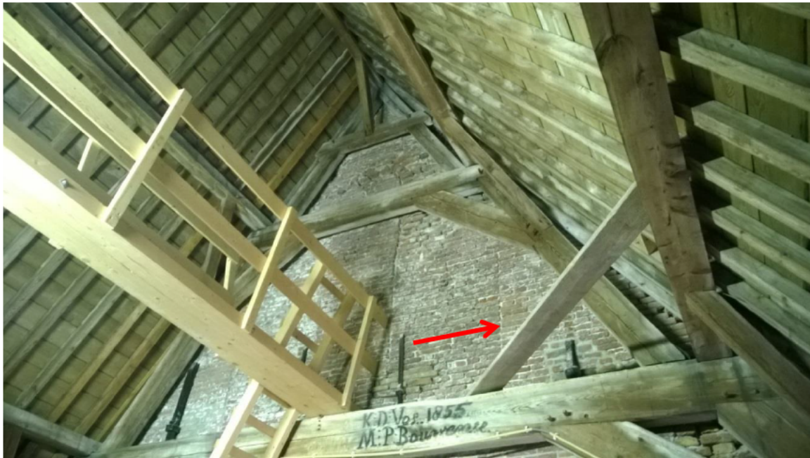
Oostelijke torengewel in kleiner formaat steen met verticale bouwnaden. Bovenin midden een boogje. Pijl geeft hoekverband aan. Ook in 1855 zullen er werkzaamheden in de kap hebben plaats gevonden