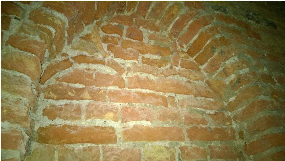
Blindnis in de noordgevel van de toren met tracering in geslepen baksteen.

In de gevels van de toren die zichtbaar zijn in de kap van de kerk, zijn velden met kloostermoppen aanwezig. Opvallend zijn vier verticale bouwnaden die overgangen markeren in betrekkelijk kleine baksteenformaten. De middelste massa is als dichtzetting te lezen van een opening die gesloten was door een boogje. De velden ter weerszijde van deze dichtzetting worden aan de noord- en zuidzijde afgesloten met een hoekverband met klisklezoren. Dit deel van de toren is uitgevoerd in baksteen met Lange Vechtformaat en zal behoren tot de 17 e eeuwse herstelling. Hieronder zijn velden met kloostermoppen aanwezig. De doorgang vanuit de kerkkap naar de toren is later aangebracht of vergroot. Blijkens een jaartal op de deur zal deze in 1896 zijn aangebracht.