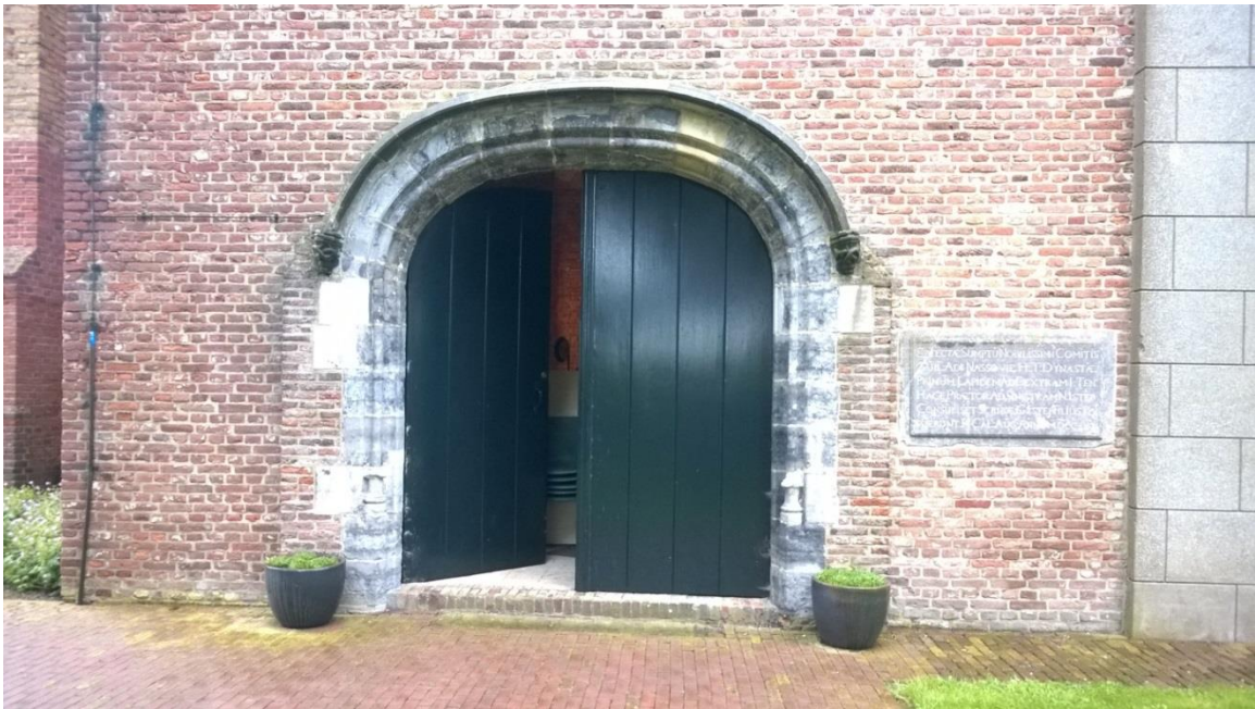
Entree van de toren, met rechts een memoristeen die herinnert aan de verbouwing van de kerk in 1754